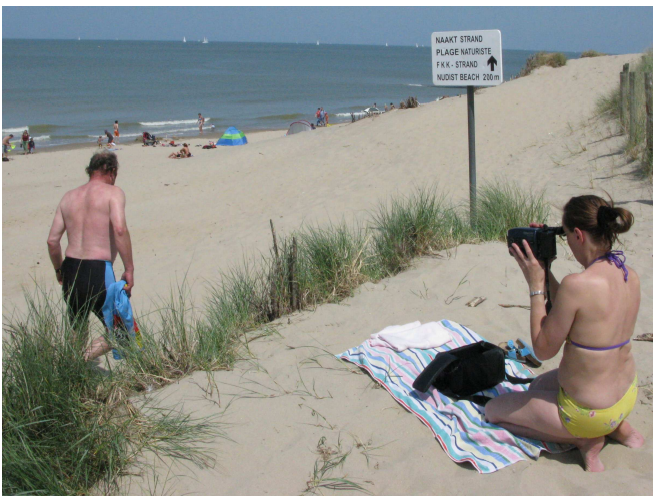
08) Et un petit détour vers la plage d'à coté ... Pas question d'incognito. La plage est à tout le monde.