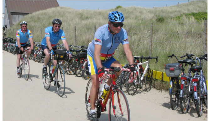
12) ... que Willy reprenne les choses en main.