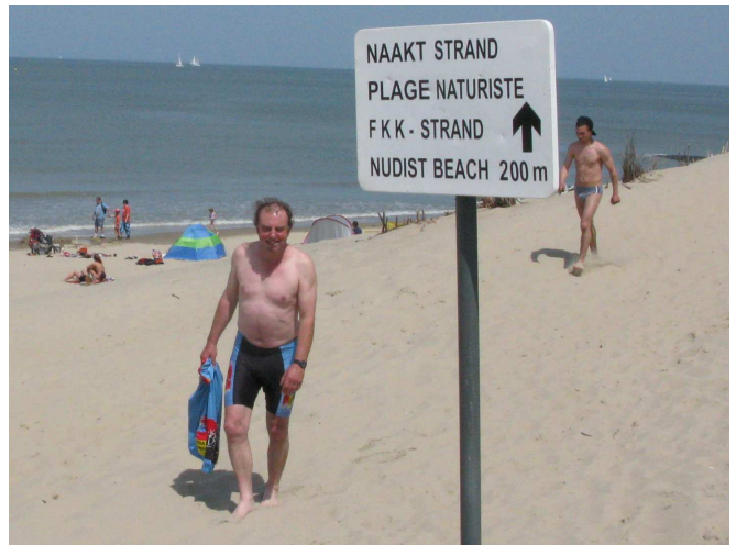
09) Le retour de celui qui a nagé dans le bonheur. Là-bas, il en a vu des vertes et des très mûres.