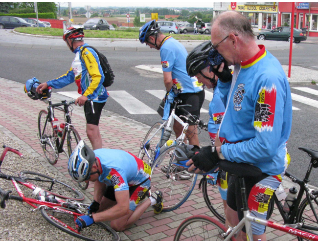
15) Mais avec arrêt de tous en cas de pépin de l'un.