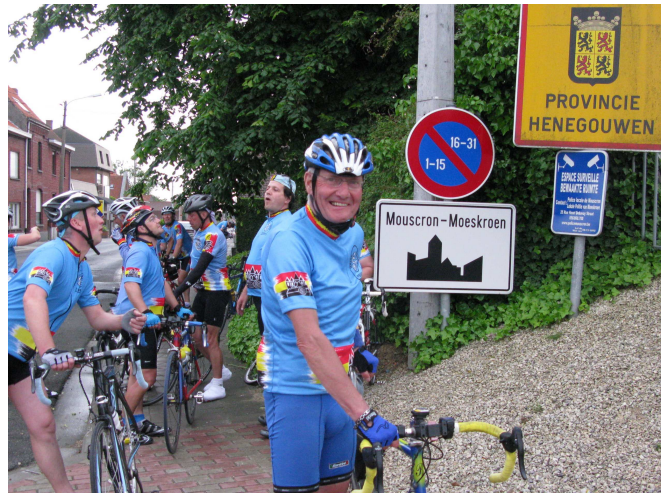
16) Même si à ce moment chacun connaît la route.