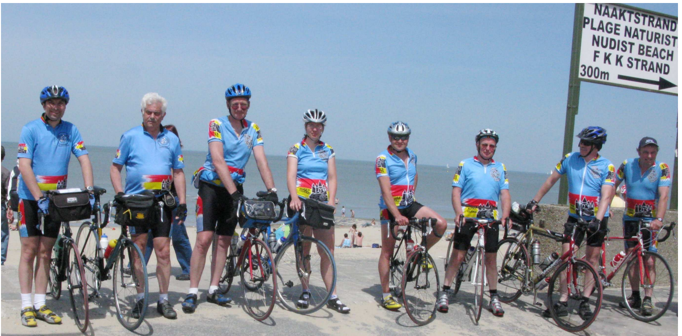
10) Pas déçus, ceux qui voulaient voir la mer, la plage et comparer les bronzages : cyclo ou intégral !