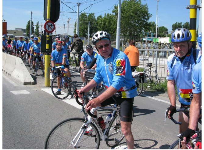
05) Et puis déjà la traversée d'Ostende et ses feux.