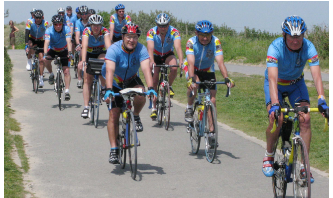
14) ... selon le principe de l'allure Audax des Audax