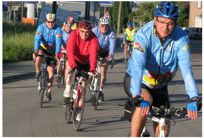
03) Alors on se contente de suivre sous le soleil.