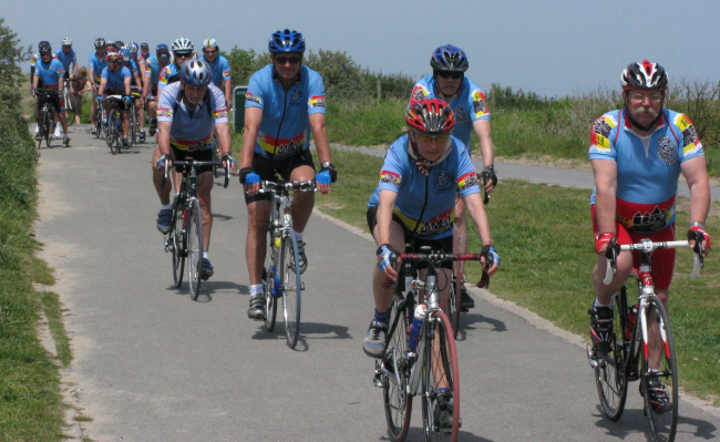
13) C'est alors le retour, toujours bien groupés ...