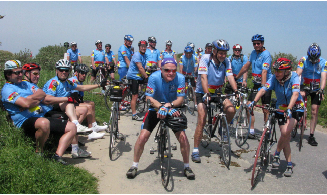
11) Pendant ce temps là il y a ceux qui attendent ...